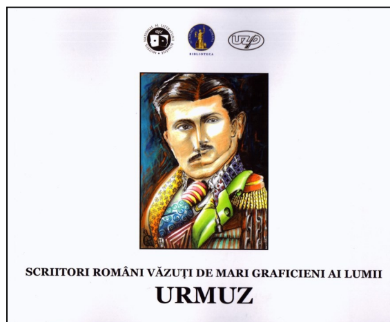
Coperta I a albumului Urmuz / 2023

Pe amândouă aceste doamne le leagă, în mintea celor care sunt dispuși să facă astfel de conexiuni, pasiunea pentru mai multe domenii ale artei, pasiunea pentru viață, chiar dacă viața este adesea crudă și neîndurătoare, o capacitate aproape înimaginabilă de a se ridica împotriva nedreptăților și de a o lua de la capăt. Amândouă au avut norocul de a cunoaște